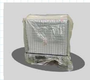
カバーとして使用時

『Zerust® と、黄色い防錆フィルムは、Northern technologies International(NTIC) と大洋シーアイエス株式会社の登録商標です。』