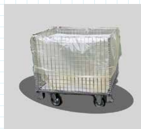
内袋として使用時